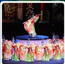
โชว์ FOSHAN QIANGQING