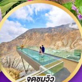
จุดชมวิวก EARTH VALLEY