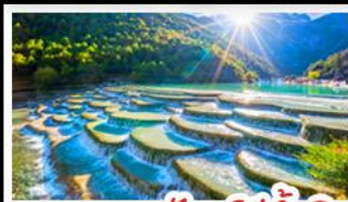
ภูเขาพระจันทร์สีน้ำเงิน

ภูเขาหิมะมังกรหยก - เมืองโบราณแชงกรีล่า วัดลามะซงจันหลิน - รถไฟหิมะภูเขาหิมะมังกรหยก สวนดอกไม้ฮาวามู่ฉาง - เมืองโบราณลี่เจียง ภูเขาพระจันทร์สีน้ำเงิน - เบบูพิเศษ สุกี้ปลาแซลมอน