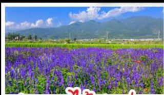
สวนดอกไม้ฮาวามู่ฉาง