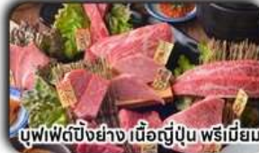
บุฟเฟ่ต์บั้งย่าง เนื้อญี่ปุ่น พรีเมียม