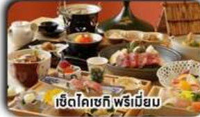
เซตโคเชกิ พรีเมียม