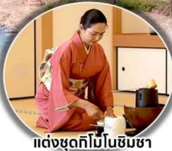
แต่งชุดกิโมโนชิมชา