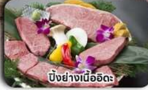
บั้งย่างเนื้ออิดะ