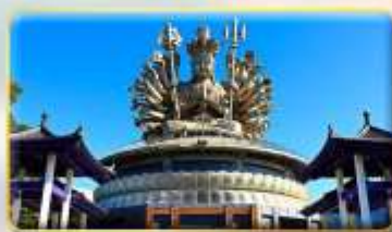
วัดกวนอิมหยวนเต้า