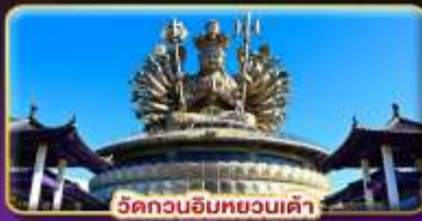
วัดกวนอิมทงหวงเต่า