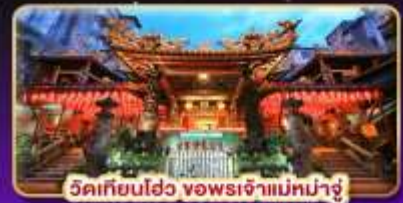
วัดเทียนเฮว ซอพรเจ้าแม่มาจู่