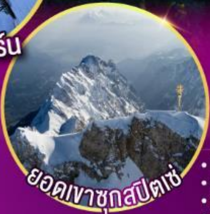
ยอดเขาชุกสปีตเซ