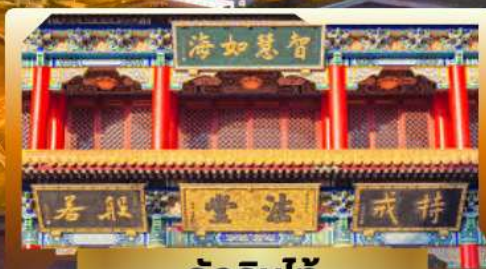
วัดจินไท่