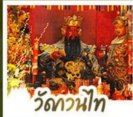
ว้ดกวนน้้ไท