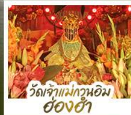
ว้ดเจ้าแม่กวนอิมอ่องฮ้า