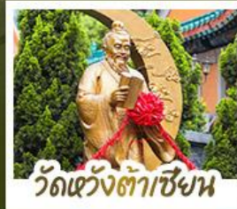
ว้ดเว้งต้าเซีงน