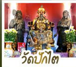
ว้ดปี้กั๊ต