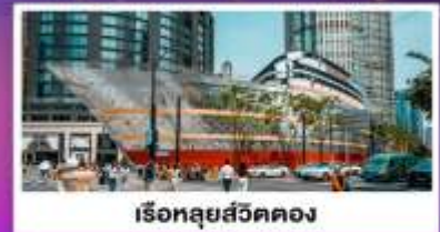
เรือหลุยส์วิตตอง