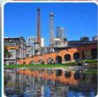
Eastern Suburb Memory Chengdu