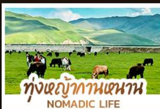
ทุ่งหญ้ากานหนาน NOMADIC LIFE