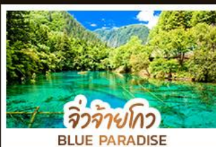
จิวจ้ายโกว BLUE PARADISE