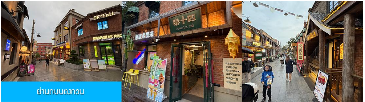
ย่านถนนตวงกวน

นำท่านเที่ยวชม จัตุรัสชิงไห่ 星海广场 เป็นจัตุรัสขนาดใหญ่เป็นแลนด์มาร์คสำคัญของเมืองต้าเหลียน สร้างขึ้นเพื่อเฉลิมฉลองในโอกาสที่รัฐบาลอังกฤษคืนเกาะฮ่องกงในให้จีนในปี ค.ศ. 1997 ตั้งอยู่ชายฝั่งทะเลในเมืองต้าเหลียน เป็นจัตุรัสใจกลางเมืองที่ใหญ่ที่สุดในโลกและ เป็นแลนด์มาร์คของเมืองต้าเหลียน รายล้อมด้วยตึกกระจาที่ทันสมัย ภายในมีบ่อน้ำพุดนตรี ลานหญ้าขนาดใหญ่ และลานกว้างสำหรับจัดกิจกรรมกลางแจ้ง อาทิ เทศกาลเบียร์นานาชาติ การแข่งขันวิ่งมาราธอน งานแฟชั่นนานาชาติเมืองต้าเหลียน ฯลฯ