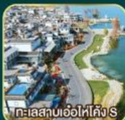
ทะเลสาบเอ๋อไห่คัง S