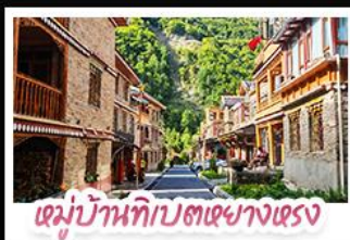
หมู่บ้านทิบตหยางหงฮาต้อ

ตะลุยเจ็ดคูหิมะต้ากู่ปิงชาน ชมเช็กอินแพนด้ายักษ์ พักใจที่หยดน้ำตาสีฟ้า! แวะชิลเมืองโบราณลั่วไต้ สัมผัสบนเต๊นท์ หมู่บ้านทิบตหยางหงฮาต้อ สัมผัสความหนาวเย็นที่ อุกยานสวรรค์ธารน้ำแข็งต้ากู่ปิงชาน แหล่งรวมวิวหลักล้าน ตื่นตาไปกับแสงสียามค่ำคั่น หยดน้ำตาสีฟ้า ณ สะพานทามาเอียว เมืองตุ้จิงเจียงน ก่อนปิดท้ายด้วยการช้อปปิ้งจุใจ ถนนชุนซู่-ไถ่กู่หลี่ และอะภาฟัก แพนด้าเซลฟ์ สูดคิดง