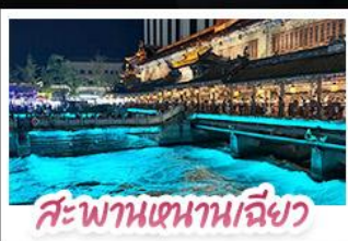
สะพานเสนาหนเจียว