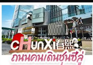
ถนนคนเดินชุนซู่