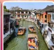
หมู่บ้านโบราณซูเจียเจี๋ย