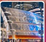
เรือหุหลู่