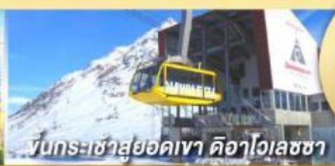
ขึ้นกระเช้าสู่ออดเขา ดือาไวเลซซา