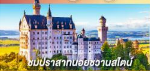
ชมปราสาทนอยชวานสไตน์