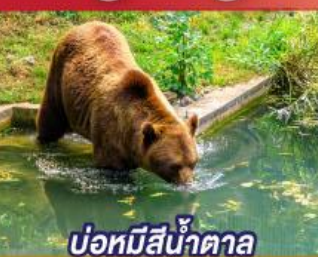
บ่อหมีสีน้ำตาล