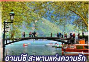
อานันชี สะพานแห่งความรัก