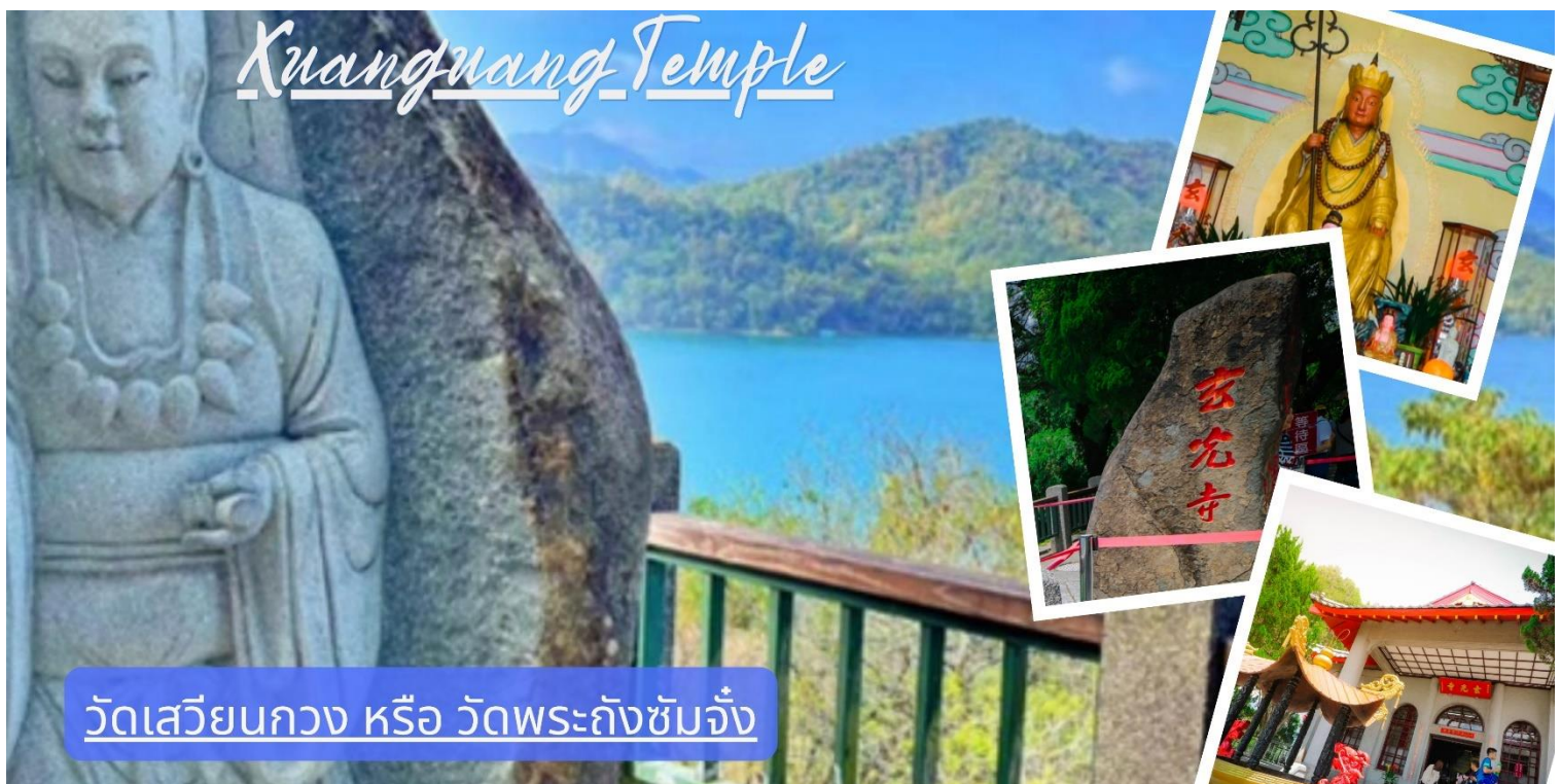
วัดเสวียนกวง หรือ วัดพระถังซำจั๋ง

จากนั้นนำท่านเดินทางสู่ วัดเสวียนกวง หรือ วัดพระถังซำจั๋ง (Xuanguang Temple) ริมทะเลสาบสุริยันจันทรา สัมผัสความงดงามของ วิวทะเลสาบสุริยันจันทรา พร้อมสักการะเพื่อ เสริมสิริมงคลด้านการเรียนและการทำงาน ที่วัดพระถังซำจั๋ง สถานที่ศักดิ์สิทธิ์และเต็มไปด้วย สถาปัตยกรรมจีนดั้งเดิม และประติมากรรมที่สื่อถึงตำนานพระถังซำจั๋ง เพลิดเพลินกับบรรยากาศสงบ ริมทะเลสาบ เหมาะกับการถ่ายภาพและพักผ่อนจิตใจ