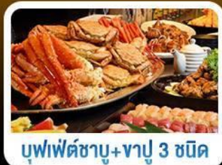
บุฟเฟต์ซาบุมุ+ซาปู 3 ชนิด

หมู่บ้านรานะอาซาฮิคาเวะ • สวนสัตว์อาซาฮิยามะ • ศาลเจ้าฮอกไกโด • สวนซึกิโซโมะโอะ • ทุ่งดอกไม้หลากหลาย • โทมิตะฟาร์ม ทุ่งดอกลาเวนเดอร์ • บลูพอนด์ • คลองไอตารุ พิพิธภัณฑ์กล่องดนตรี • หอนาฬิกาโบราณ สัญลักษณ์เมืองซัปโปโร • ร้านอาหารฟู ฮัลโหล คิตตี้ ศาลาที่ว่าการเมืองเก่า • เนินเขาแห่งพระพุทธรเจ้า • ซอปปิง Mitsui outlet • ย่านซอปปิงทานุกิโคจิ