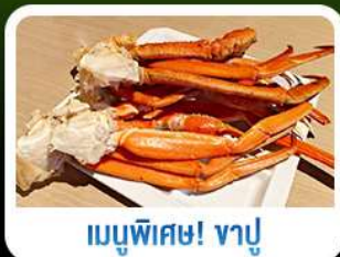
เมนูพิเศษ! ซาซิมิ