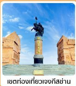
เขตท่องเที่ยวเจงกิสข่าน