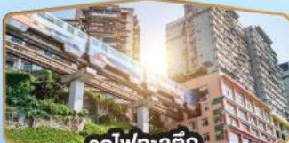
รถไฟฟ้า-สุตึก