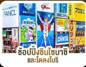
ช้อปปิ้งชินไซบาชิ และโดตงโบริ