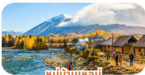
หมู่บ้านเหมอู่