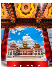
วัดโพธิ์สัตว์