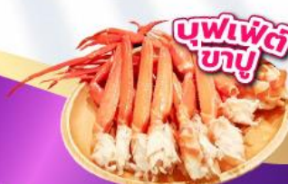
บุฟเฟ่ต์ ซาชิมิ