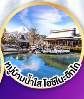
หมู่บ้านน้ำใส ไอชิโนะ-ซึกาโ