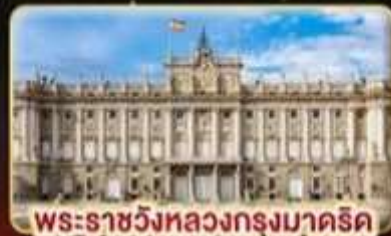
พระราชวังหลวงกรุงมาดริด