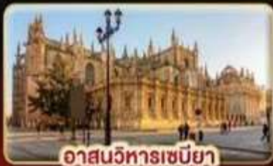
อาสนวิหารเซบิยา