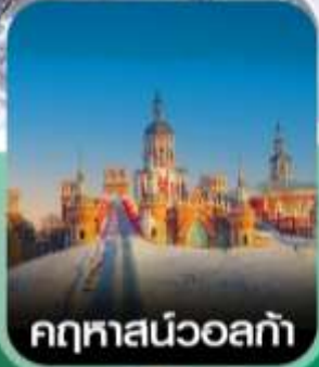
คฤหาสน์วอลก้า