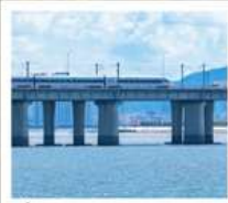
นั่งรถไฟใต้ดินข้ามทะเล