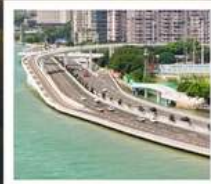
สะพานเหยียนหู่เฉียว

1 ประเทศ 2 ระบบ ในทริปเดียว!! ข้ามทะเลจากจีน...สู่จินเหมิน (ใต้หวัน)