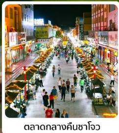
ตลาดกลางคืนซาโจว