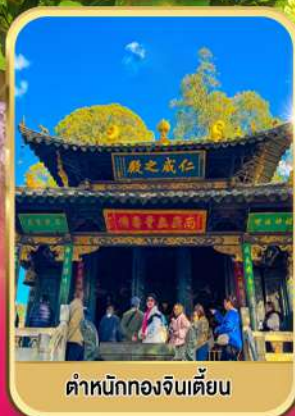
ตำหนักทองจินเตียน