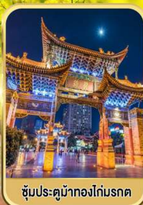
ซุ้มประตูม้าทองไถ่มรดก