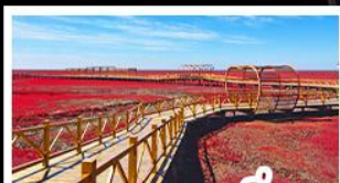
หาดแดงผานฉิน