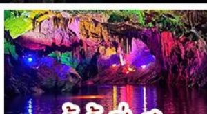
ถ้ำน้ำเป็นสี