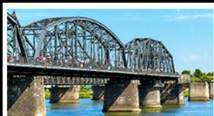
สะพานหวาดถานตง

2 มหัศจรรย์ธรรมชาติระดับโลก "หาดแดงผานฉิน" คู่กับ "ถ้ำน้ำเป็นสี" ยืนมองฝั่งเกาหลีเหนือที่ตามอง • ชมความยิ่งใหญ่ของพระราชวังเส้นหยางกู่กิง