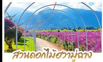
สวนดอกไม้ฮามูฉาง