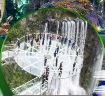
สะพานแก้วคู่หลงเซี่ยะ