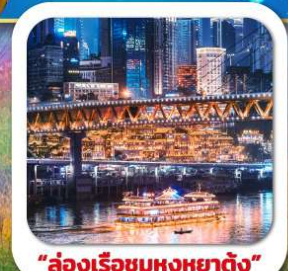
"ล่องเรือชมหงหยาดัง"