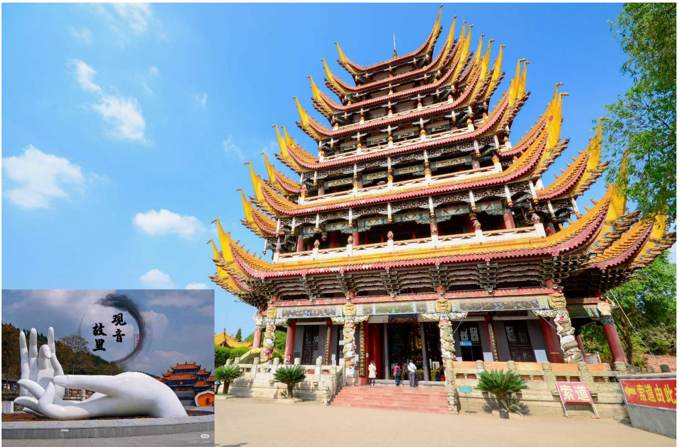
T2G-CKG36FD ฉงชิ่ง กวางฉู่ชาน...วัดหลิงฉวน ต้าจู่ ชมถนนแปะก๊วย 5D 4N (FD)

จากนั้นนำท่านเดินทางสู่ วัดหลิงฉวน (Lingquan Temple) หรือ วัดเจ้าแม่กวนอิมกระพริบตา เป็นวัดเก่าแก่ซึ่งสร้างขึ้นในปลายราชวงศ์สุย (ค.ศ. 581 - 618) และบูรณะพัฒนาต่อเนื่องมา มีความเชื่อว่าเป็นวัดที่มีความศักดิ์สิทธิ์อย่างมาก มีเรื่องเล่ากันว่า เมื่อครั้งเกิดแผ่นดินไหวที่มณฑลเสฉวน ชาวบ้านที่มาสักการะเห็นเจ้าแม่องค์นี้ได้กระพริบตาและหลั่งน้ำตา เสมือนท่านสงสารชาวผู้ประสบภัย ภายในวัดแห่งนี้ยังได้แสดงประวัติของเจ้าแม่กวนอิม วิหารเจ้าแม่กวนอิม ภายในวิหารเจ้าแม่กวนอิม มีองค์เจ้าแม่กวนอิมยืนสูง 18.6 เมตร