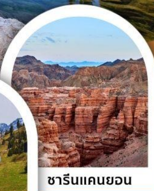
ซารินแคนยอน