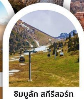
ซิมบูลัก สกีรีสอร์ท