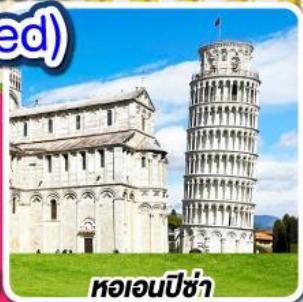
หอนอนปิซ่า