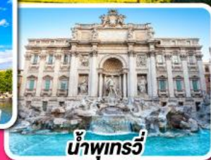
น้ำพุทรวี่