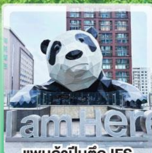
แพนด้าป็นตึก IFS