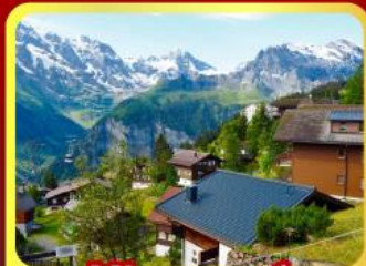
หมู่บ้านเมอร์ส