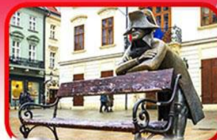
ย่านเมืองเก่าบราติสลาวา

เที่ยวเมืองสวยริมทะเลสาบ ฮัลล์สตัดท์ • ชมเมืองไข่มุกแห่งโบฮีเมีย เซสกี กรุงลอน • ปราก • เวียนนา • ซอปปิงพาร์นดอร์ฟ เอาก์เล็ท